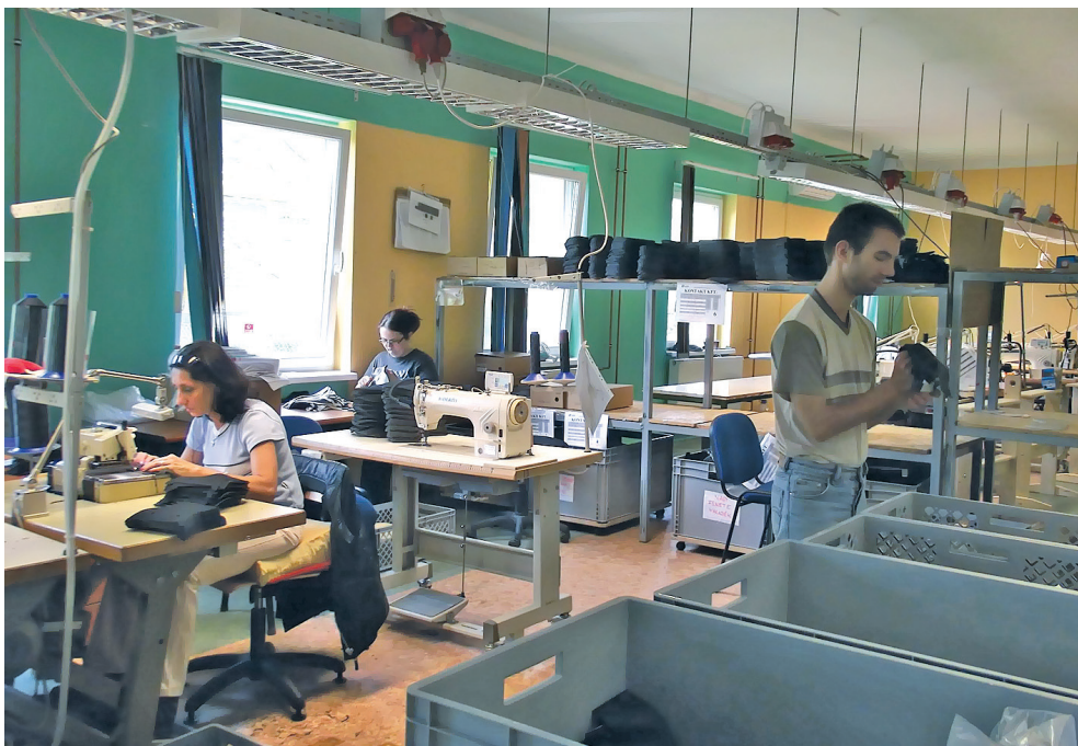
Az üzemi tanács elsődleges feladata az üzemben dolgozók érdekvédelme

A jövőben az üzemi tanács legfontosabb feladatai közé tartozik a rehabilitációs foglalkoztatáshoz szükséges beszámolók, szakmai dokumentumok véleményezése, valamint a cég munkavállalóinak érdekvédelme.