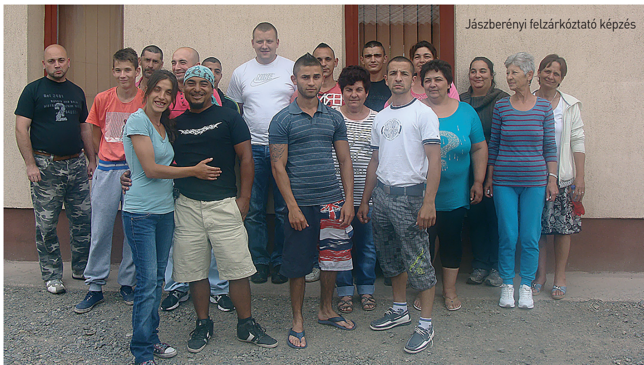
Jászberényi felzárkóztató képzés