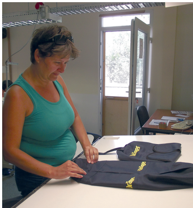
A tűzoltópalack védőhuzat meózása