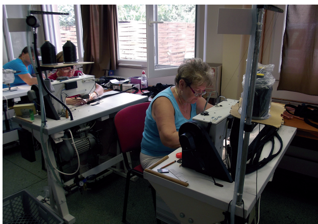
Készülnek a kutyahámok

- Itt vannak például a speciális, tűzoltók részére készülő, tűzoltópalack védő/tartóhuzatok, melyekhez speciális tűzálló cérnát használunk. Emellett új megbízásként kutyahámokat készítünk egy tótkomlói kft. részére bér munkában. Összesen ötféle hámot készítünk, ebből négyet itt Szolnokon, egyet pedig Kuncsorbán varrnak a kollégák.