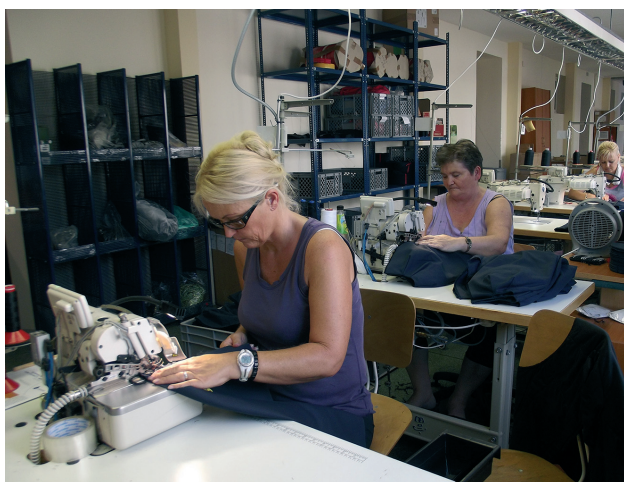
A védőhuzatok varrása

Mindezek mellett elképzelhető, hogy lesz még újabb munka – teszi hozzá.